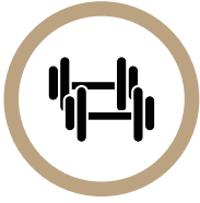
기구 사용 후 정리