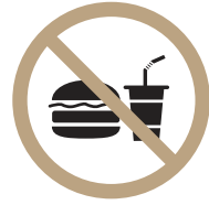
음식물 반입 금지