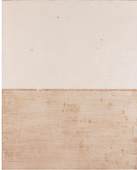
김근태, DISCUSSION_117x91cm, Mixed media

기간 2026년 1월 7일 (수) - 2월 2일 (월) | 장소 클럽동 로비 | 문의 02 2250 8084, 8085