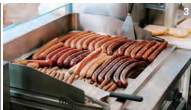
1 비엔나의 중심부인 링슈트라세 풍경.